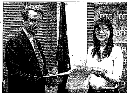
Firma del convenio entre ACAM y ATA.

La citada asociación de autónomos brindará a ACAM.