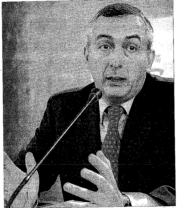
El secretario de Estado de Hacienda, Carlos Ocaña, es el responsable de la reforma fiscal que quedó aprobada en el Congreso el jueves pasado.

No obstante, se han aprobado medidas más polémicas como que los intereses que reciben los socios como remuneración por estos préstamos se incluirán en la base general del IRPF y no en la base del ahorro, lo que, según los expertos, repercutirá negativamente en los préstamos aportados por los socios a las empresas.