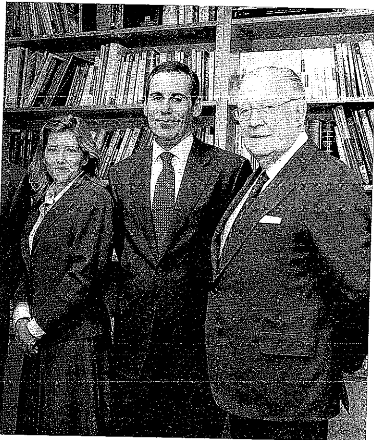
JUAN ANTONIO XIOL RÍOS PTE DE LA SALA 1ª DEL TRIBUNAL SUPREMO

recalcó. Ahora existe un mayor conocimiento hasta el punto de que se llegó a afirmar que "quien no sabe un poco de arbitraje es porque no quiere".