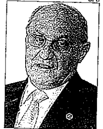
Francisco José Hermando, pte. del CGPJ

El Consejo de Ministros, a propuesta del ministro de Justicia, Juan Fernando López Aguilar, ha aprobado un anteproyecto de ley por el que se modifica la