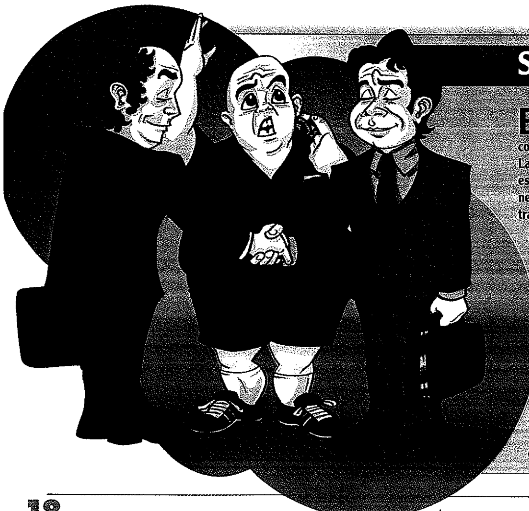
Ilustración: LANDER AYLLON

El primer paso para resolver un conflicto mercantil por la vía arbitral es contar con el acuerdo de las dos partes. La decisión puede haber sido a priori (en este caso el contrato suscrito debiera tener una cláusula que contemple el arbitraje) o a posteriori. Las distintas cortes y organismos arbitrales aconsejan la primera opción por considerar difícil conciliar posturas cuando ya existe el conflicto, si bien, según la Corte Española de Arbitraje, en el 8% de los casos las partes deciden optar por el convenio arbitral a posteriori. Si se trata de un arbitraje en el seno interno de la sociedad (el conocido como arbitraje societario), ya sea entre dos socios, un socio con la propia empresa, etc., la cláusula de arbitraje suele incluirse en los estatutos sociales.