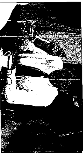
Si eres empresario único la vivienda heredada por tu pareja no sufrirá embargo.

R: Los bienes adquiridos a título gratuito -aún después del nacimiento del régimen económico de bienes gananciales- son de carácter privativo, según establece el Art. 1.346.2º del Código Civil. Por lo tanto, los bienes que tu mujer ha recibido como consecuencia de la herencia de sus padres le pertenecen exclusivamente a ella. A su vez, no existe perjuicio alguno de que ambos lo podáis distribuir.