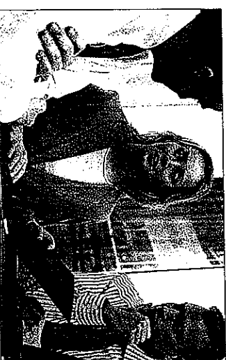
La decisión arbitral tiene el mismo valor que una sentencia judicial.

Las principales ventajas de esta práctica respecto a la vía judicial es la poca duración de tiempo y el bajo coste del proceso.