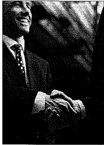
El arbitraje aporta a las empresas procedimientos más rápidos y baratos que la vía judicial.

● Más información en el teléfono 91 423 29 00.