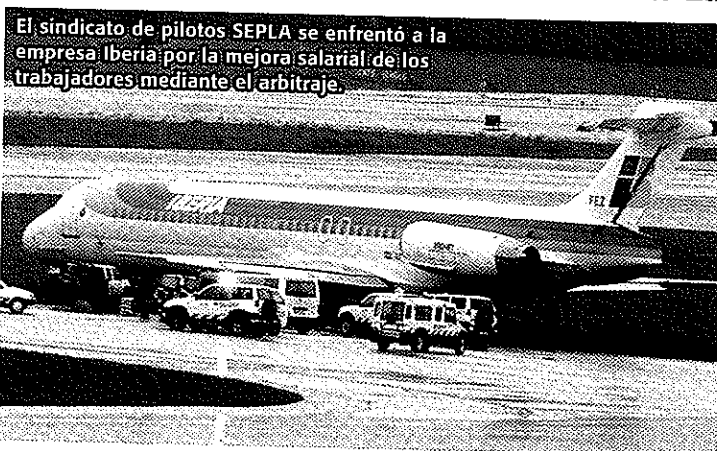
El sindicato de pilotos SEPLA se enfrentó a la empresa Iberia por la mejora salarial de los trabajadores mediante el arbitraje.

mercantil, frente al 16% de índole civil.